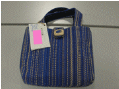
●大賞 機織りバッグ 千葉県鎌取福祉作業所つばさの家 (千葉市緑区)

(評)製品がしっかり作られており色合いもよい。値段も手ごろ感があり総合的に優れた製品。