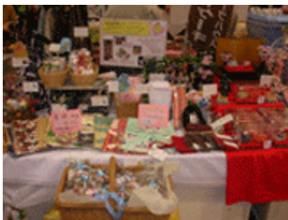
●大賞 ウイング (我孫子市)

(評)季節感あふれる商品・品揃え。商品のレベルも高く、お客様をひき付けるハイセンスなレイアウトとなっている。