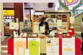
Community Cafe b