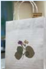
点・点バッグ トライアングル西千葉